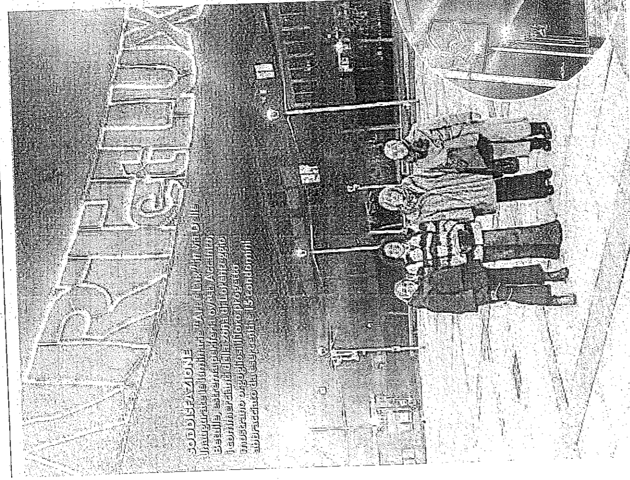
SODDISFAZIONE Lungo via Betulle, le luminarie. A sinistra, in via Delle Betulle, la struttura per la festa. A destra, il fiorino di via Delle Betulle. In basso, il progetto presentato dagli esponenti del consiglio di amministrazione dei condomini

GLI ESERCENTI DI ASSELOR HANNO PROMOSSO L'INIZIATIVA CON 240 FILARI SPLENDENTI